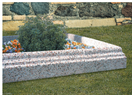
Bordillo con escuadra exterior tricolor