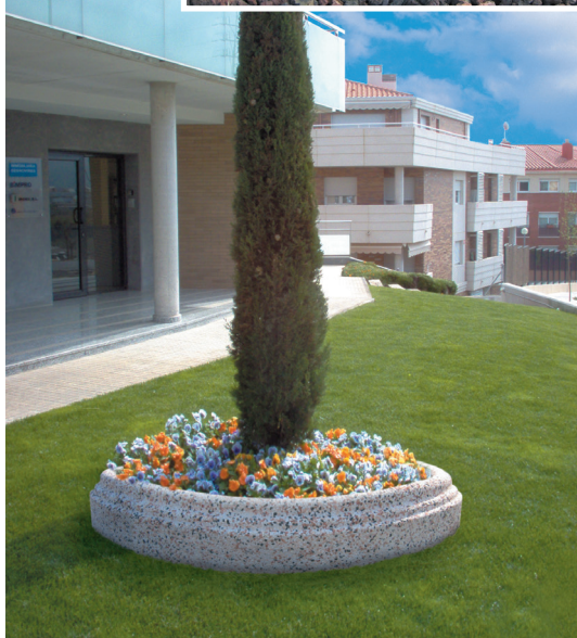
Aro tricolor con relieve