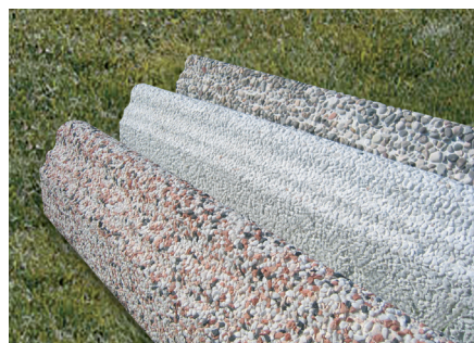
Bordillos con relieve